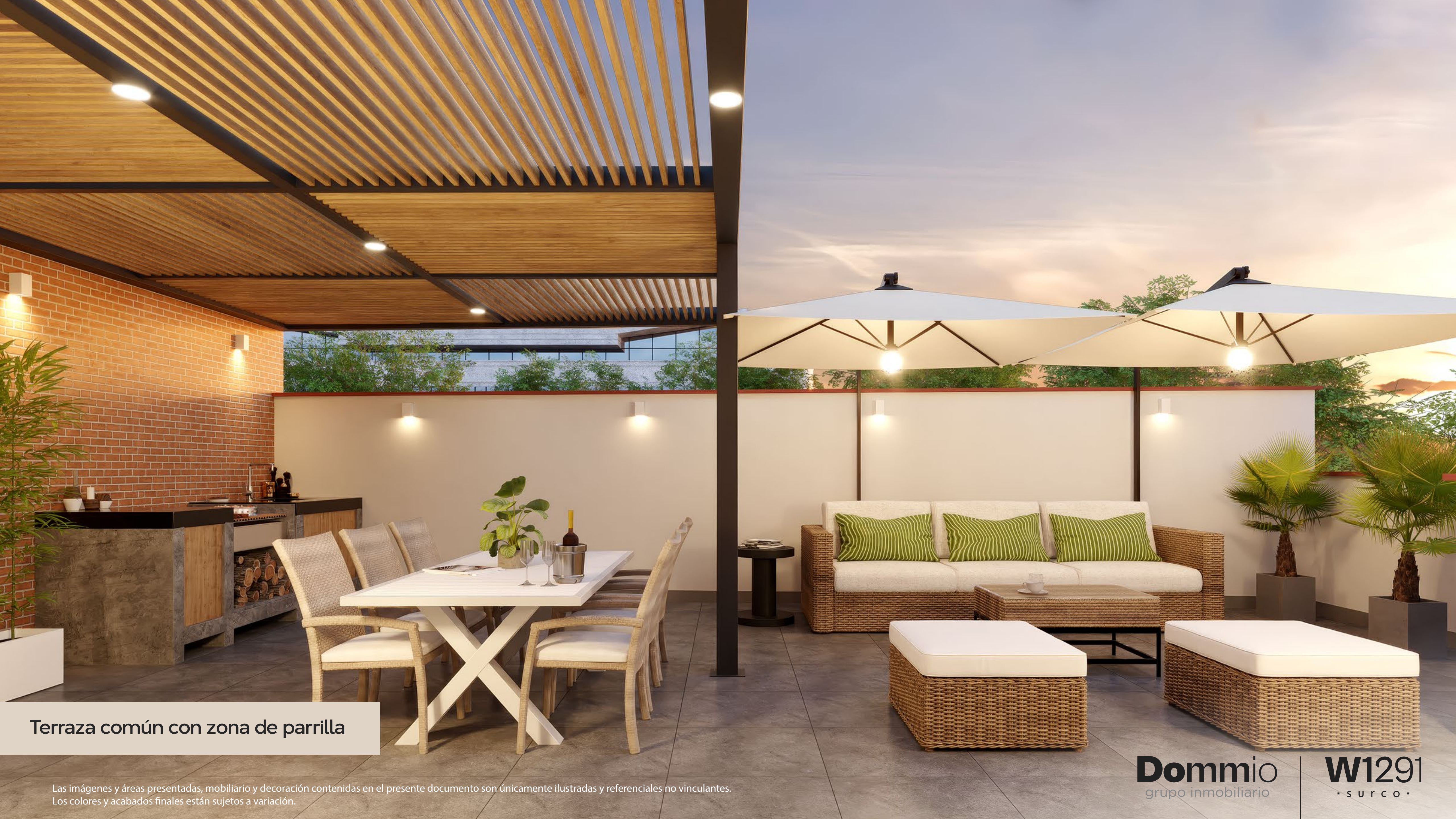
Terraza común con zona de parrilla