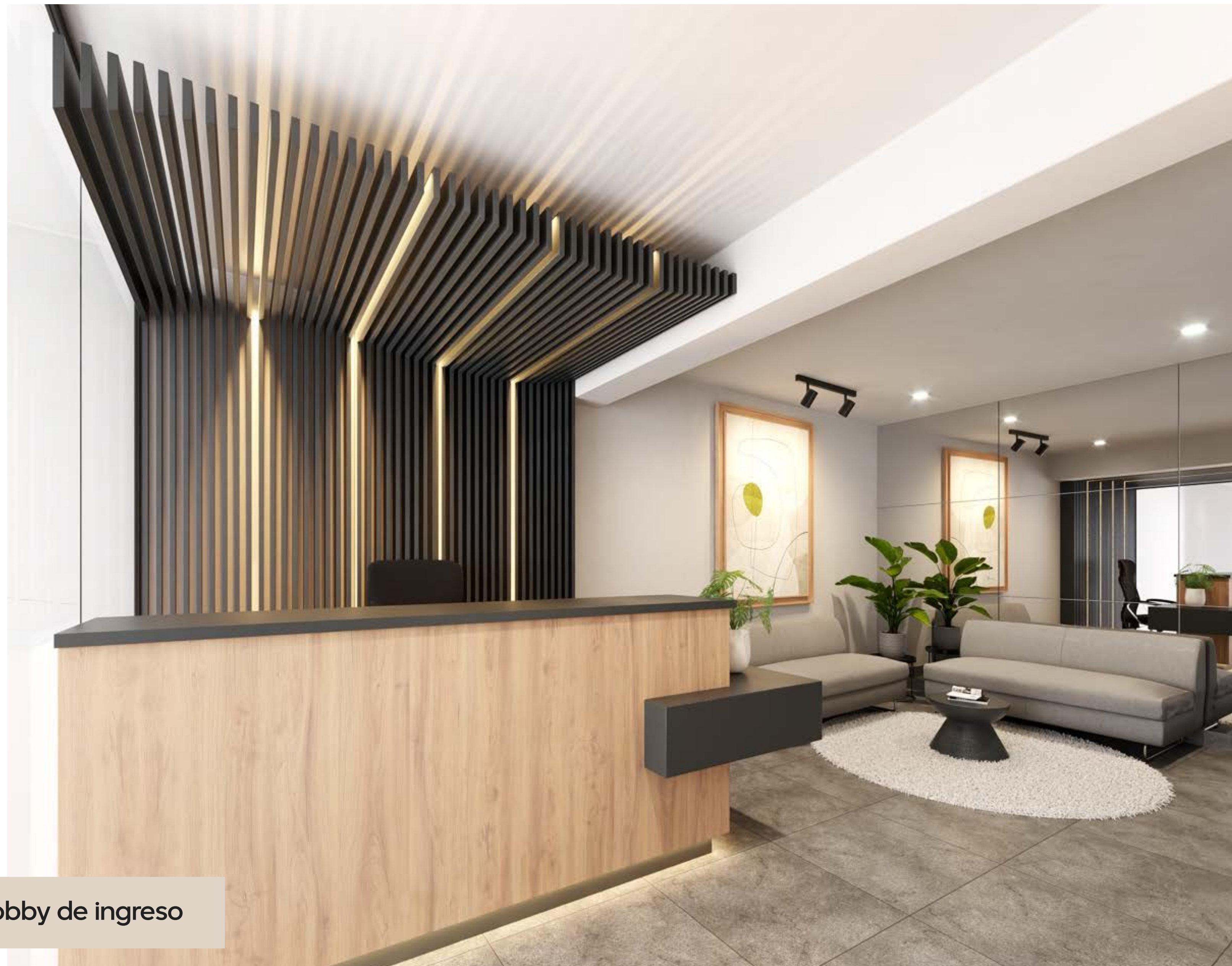
Lobby de ingreso